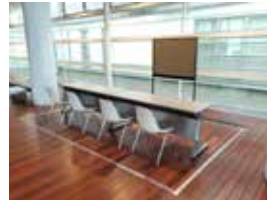
(幅 約4.0m × 奥行 2.5m)