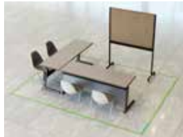
(幅 約3.6m × 奥行 2.7m)